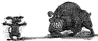
Rico... ou Rosalie ?

A) Composez des phrases avec le comparatif. Utilisez les images pour vous aider.